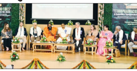
हरिद्वार। पतंजलि अनुसन्धान संस्थान और पतंजलि विश्वविद्यालय के तत्वधान में दो दिवसीय अंतराष्ट्रीय सम्मेलन पी2पी4 एथनोफार्माकोलॉजी बियान्ड टाइम्स सम्पन्न हुआ।