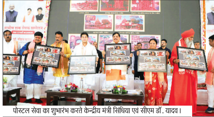
पोस्टल सेवा का शुभारंभ करते केंद्रीय मंत्री सिंधिया एवं सीएम डॉ. यादव।