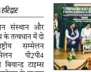
हरिद्वार। पतंजलि अनुसन्धान संस्थान और पतंजलि विश्वविद्यालय के तत्वधान में दो दिवसीय अंतराष्ट्रीय सम्मेलन पी2पी4 एथनोफार्माकोलॉजी बियान्ड टाइम्स सम्पन्न हुआ।