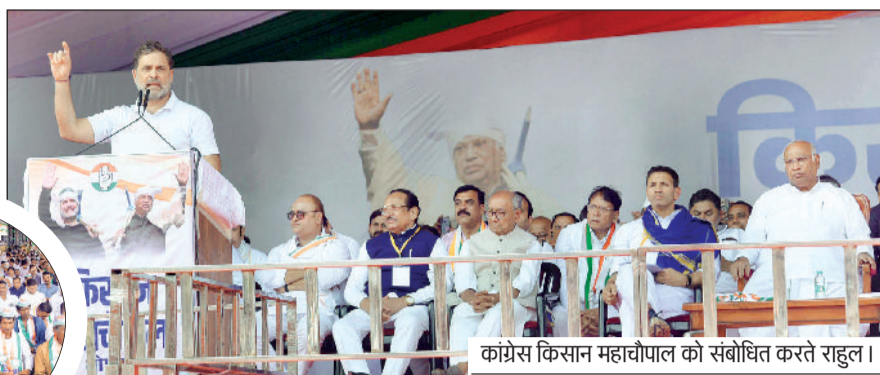
कांग्रेस किसान महाचौपाल को संबोधित करते राहुल।